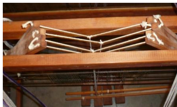
Détail de l'équipage du métier à tisser domestique en cours de restauration dans l'atelier du Musée (MRC2013/06/03).

Olivier CLYNCKEMAILLIE Conservateur du Musée de la Rubanerie cominoise