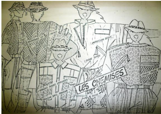
Une nouvelle voie textile empruntée par Dalle & Cie dans la mode des années 1980 : les rubans et les pièces à façon.

Dans les années 1980, en plus d'une collection dénommée « Les Mercenaires de la paix », remettant en valeur le vrai kaki et les vraies couleurs de camouflage héritées de la mode militaire, le tout mêlé aux motifs dits « ethniques », Dalle créa même un kit permettant aux dames d'assembler elles-mêmes les différentes pièces d'un soutien-gorge !