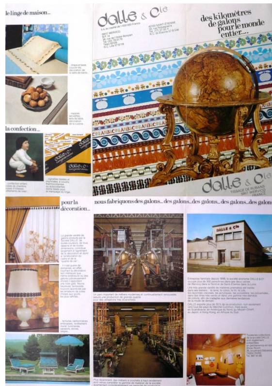
Prospectus Dalle & Cie datant des années 1970.

Parmi les grandes entreprises rubanières de notre région, « Dalle & Cie », située à Wervicq-Sud, s'est fait une spécialité dans le ruban décoratif et, plus particulièrement, dans le domaine de la passementerie. Mais elle fut aussi la créatrice de pièces de tissus en tous genres. A sa grande époque, elle aura, en plus d'une salle d'exposition de prestige à Paris (boulevard de Sébastopol), une autre usine à Saint-Etienne.