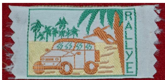
Enfants et familles admis ? C'est au Musée de la Rubanerie ! Ruban tissé chez Dalle dans les années 1980 (MRc490).