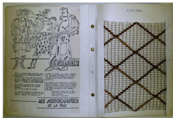
Quand Dalle prend le train de la mode « jeune » en marche, les tissus « militaires » reprennent du galon (années 1980).

Parmi les grandes entreprises rubanières de notre région, « Dalle & Cie », située à Wervicq-Sud, s'est fait une spécialité dans le ruban décoratif et, plus particulièrement, dans le domaine de la passementerie. Mais elle fut aussi la créatrice de pièces de tissus en tous genres. A sa grande époque, elle aura, en plus d'une salle d'exposition de prestige à Paris (boulevard de Sébastopol), une autre usine à Saint-Etienne.