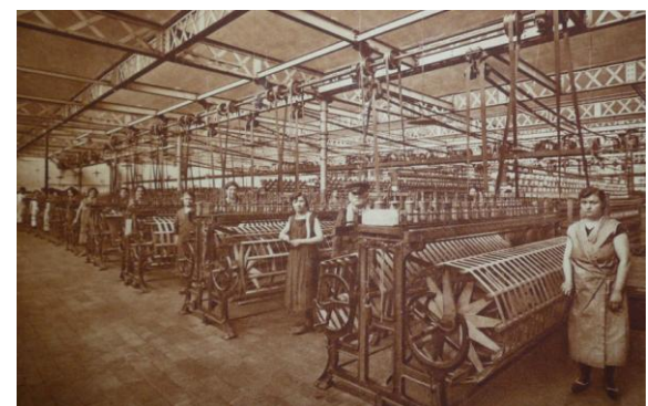
L'unité de dévidage de l'usine F.F.F. à Comines (MRC1674) : un document promotionnel (1920) gorgé de mémoire(s)...