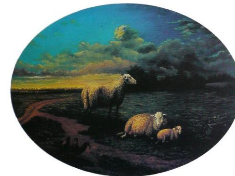
« Lionnes » (s.d.) et « 3 moutons, 2 coqs » (1859), deux œuvres d'Eugène Verboeckhoven.