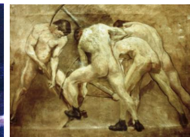
« Christ mort » et « Les travailleurs » : une même foi de Degroux en l'Homme !