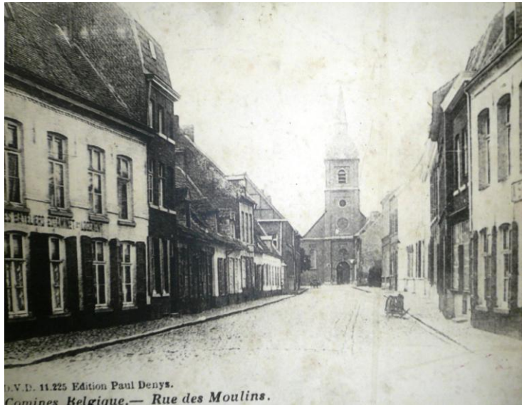
La rue des Moulins, vers 1900, au centre du quartier appelé « Le Fort » : des tisserands y œuvraient à domicile avant de rejoindre les usines. C'était aussi le quartier des « foulons », situé en bord de Lys.

Le Musée de la Rubanerie cominoise garde la mémoire textile d'une ville, Comines-Warneton, mais encore de toute une région transfrontalière dont l'essor débute vers la fin du douzième siècle. En ce temps-là, la draperie faisait florès d'Ypres à Lille, d'Arras à Bruges et Gand par le truchement d'un matériau de qualité que nos tisserands travaillaient avec passion : la laine anglaise. A Comines, les artisans « textiliens » profitent d'une situation exceptionnelle : clef de passage entre les parties françaises et flamandes du comté de Flandre, Comines reçoit les alluvions généreuses de la Lys qui sont très vite mises au service de l'apprêtage du drap tissé (c'est l'opération appelée « foulage » ou lavage de la pièce d'étoffe dans un bain d'eau et d'argile dont le résultat est semblable à l'amidonage).