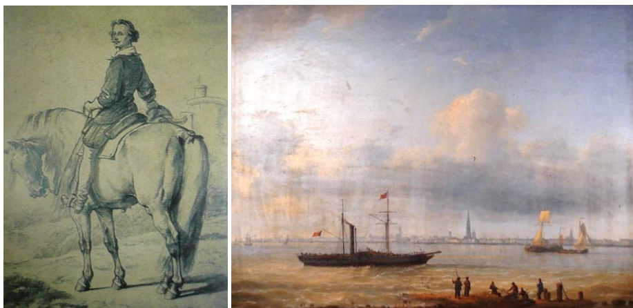
« Cavalier espagnol », par Eugène Verboeckhoven et « Port d'Anvers », par Charles-Louis Verboeckhoven.

Mais à côté d'Eugène Verboeckhoven, la salle de justice renferme une huile sur panneau de son frère Charles-Louis (1802-1889), connu pour ses marines dans lesquelles les glacis mettent en valeur une lumière qui, en plus de révéler le sujet, sculpte délicatement, voire classiquement, le paysage, dans la grande tradition des peintres français comme Le Lorrain (1600-1682) ou britanniques tel Bonington (1802-1828).