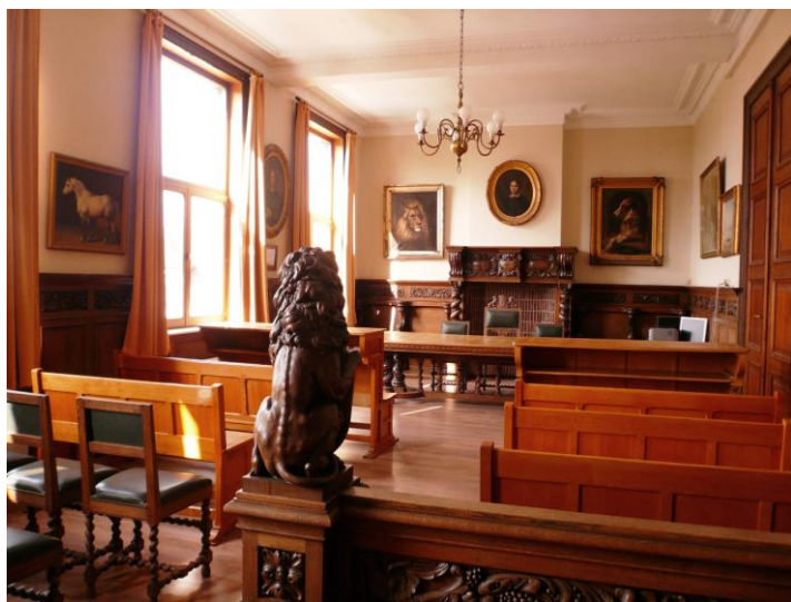
A Warneton, la salle de justice conserve une collection impressionnante d'œuvres d'E. Verboeckhoven.

Au sortir de la première guerre mondiale, Comines est totalement détruite. Plus personne n'ose parier un kopek sur son avenir industriel. Pourtant, les rubaneries ne tardent pas à se reconstruire et leurs machines à faire chanter les navettes ! De nouvelles lois sociales émergent peu à peu, balisant au mieux le travail des rubaniers et autres ouvriers. Comines se repositionne comme centre textile et décide de jouer la carte de la main d'œuvre de qualité. Aujourd'hui encore, malgré des révolutions techniques parfois défavorables à l'emploi car nécessitant moins de personnel, le textile de pointe reste un des fleurons économiques de l'entité.