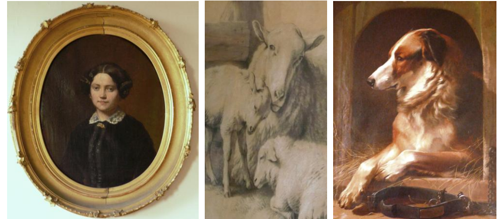
« Femme », « Moutons » (détail) et « Chien » (1858) : trois chefs-d'œuvre d'Eugène Verboeckhoven.

Au dernier étage de l'Hôtel de Ville de Warneton, après avoir goûté aux reproductions de toiles grandeur nature introduisant au parcours du maître, la salle de Justice témoigne d'une collection importante, autant que diversifiée, d'œuvres d'Eugène Verboeckhoven. A côté de portraits officiels réalisés à l'huile ou au fusain, un théâtre animalier lève le voile sur un bestiaire humanisé. L'appartenance de l'artiste au mouvement romantique y explose, tout comme sa maestria.